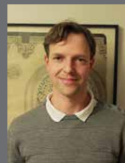
Kontaktperson Martin Krøier Krak